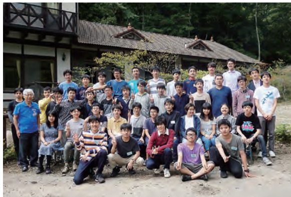
2019年夏季セミナー写真

今年も8月23日(日)～29日(土)に昨年と同じ山梨県の清里で行う予定ですが新型コロナウイルスの感染拡大への対応により、夏季セミナーの実施が危ぶまれています。今後、当財団ホームページ等で実施の有無や応募期間・参加資格等をご確認の上、応募してください。