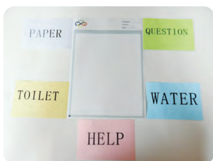
コンテストグッズ

その他コーディネーション最終日の夜にオリンピックの開会式が開催された。こちらは終わりがけであったので、不思議な気分になった。